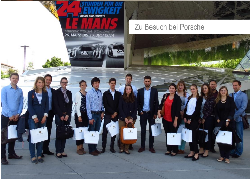
Zu Besuch bei Porsche