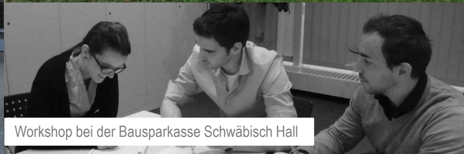
Workshop bei der Bausparkasse Schwäbisch Hall