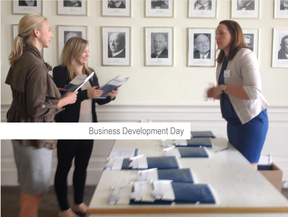
Business Development Day