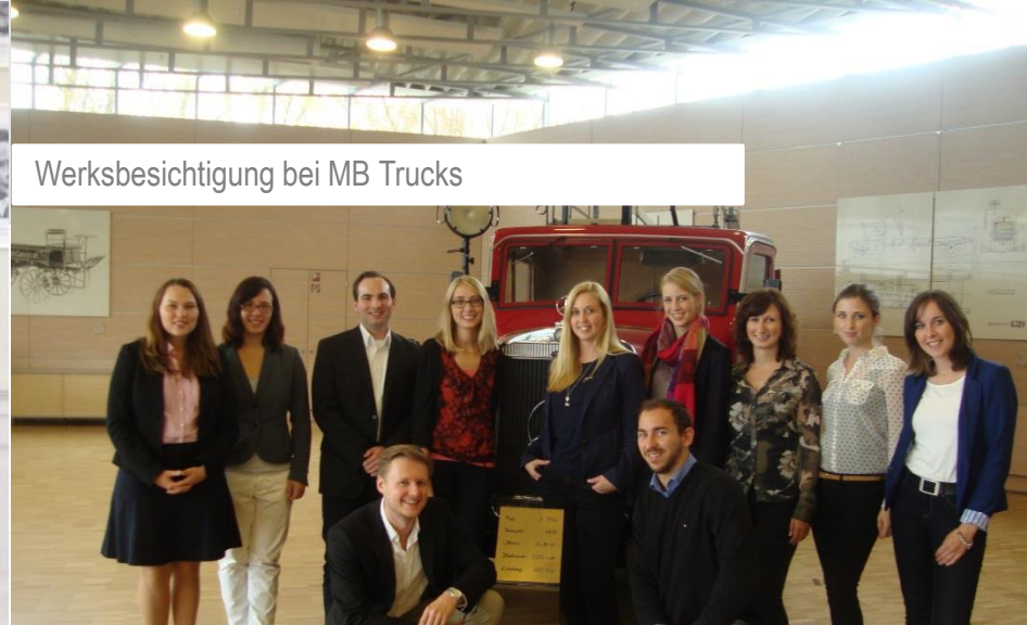
Werksbesichtigung bei MB Trucks