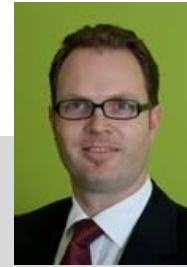
Prof. Dr. Hadwich Lehrstuhl für Dienstleistungsmanagement