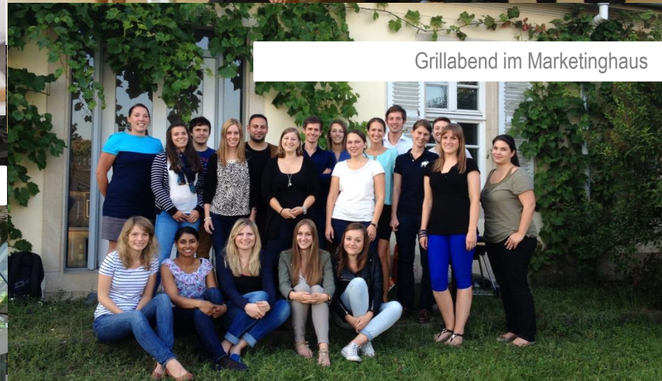
Grillabend im Marketinghaus