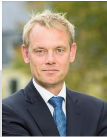
Prof. Dr. Voeth Lehrstuhl für Marketing & Business Development