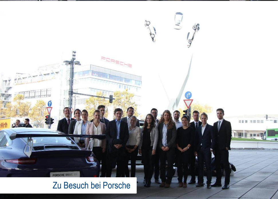
Zu Besuch bei Porsche