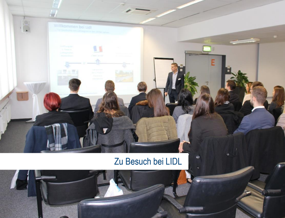
Zu Besuch bei LIDL