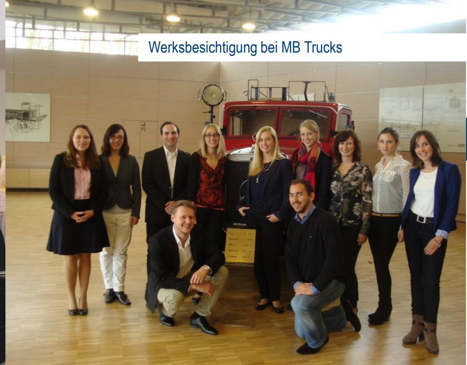
Werksbesichtigung bei MB Trucks