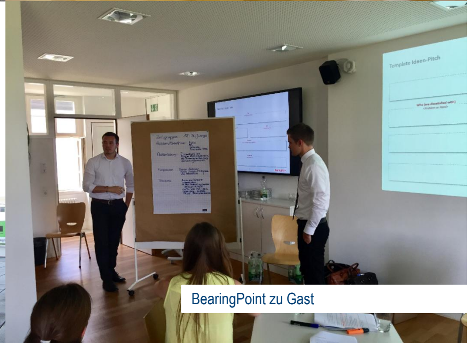
BearingPoint zu Gast