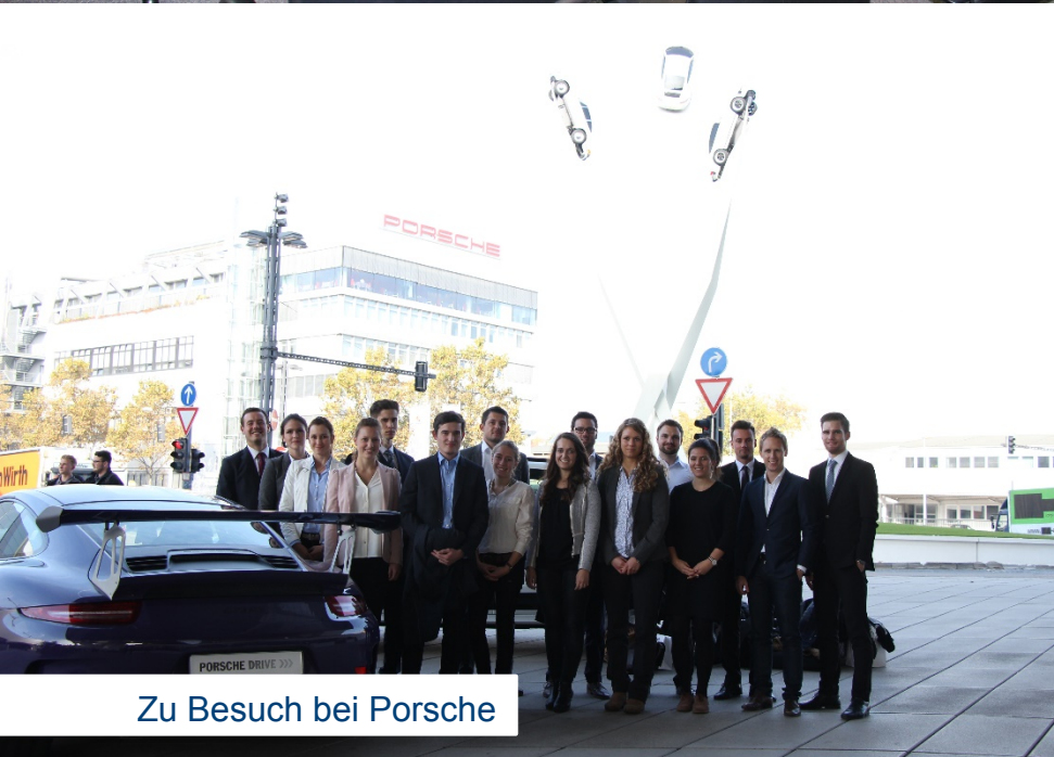
Zu Besuch bei Porsche