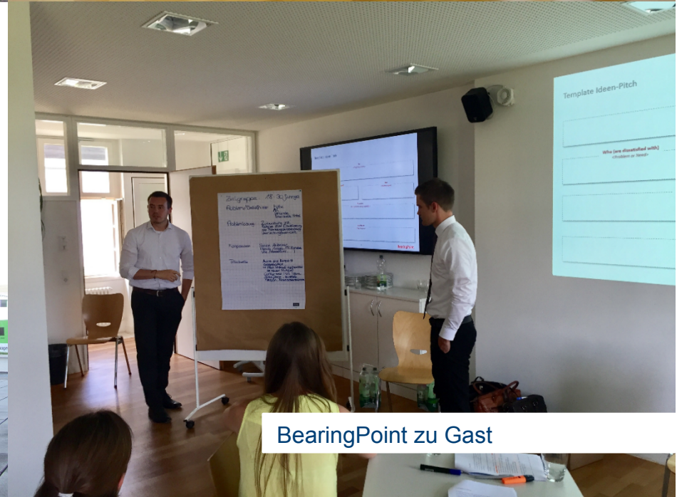
BearingPoint zu Gast