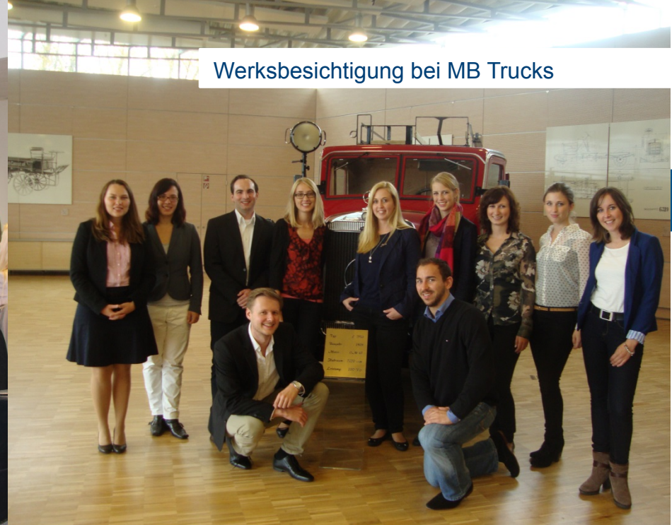
Werksbesichtigung bei MB Trucks