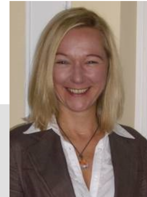
Prof. Dr. Büttgen Lehrstuhl für Unternehmensführung

Darüber hinaus wird der Marketing & Management Excellence Circle vom Förderverein für Marketing & Business Development e.V. an der Universität Hohenheim unterstützt.