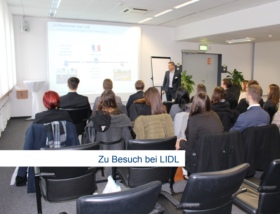
Zu Besuch bei LIDL