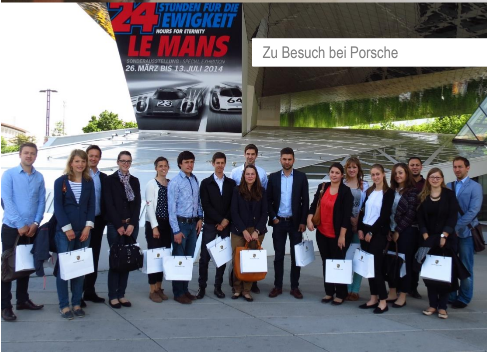
Zu Besuch bei Porsche