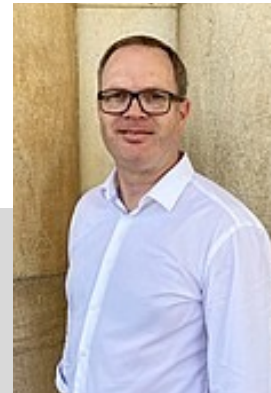
Prof. Dr. Hadwich Lehrstuhl für Dienstleistungsmanagement