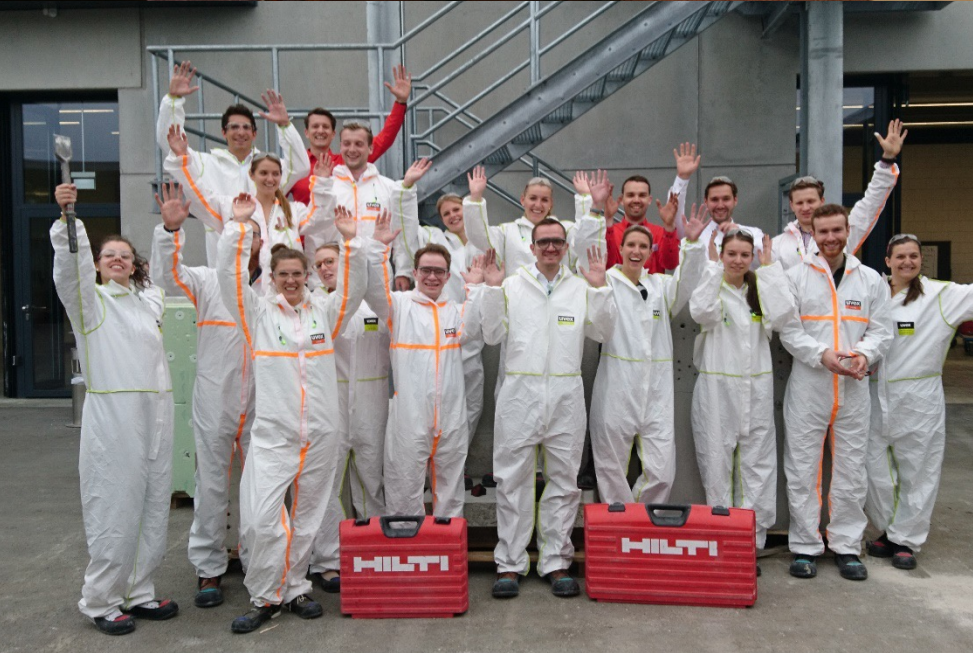
Werksbesichtigung und Produkt-Testing bei Hilti