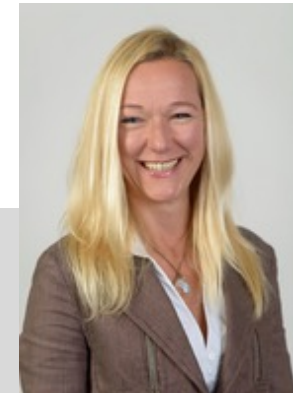
Prof. Dr. Büttgen Lehrstuhl für Unternehmensführung

Darüber hinaus wird der Marketing & Management Excellence Circle vom Förderverein für Marketing & Business Development e.V. an der Universität Hohenheim unterstützt.