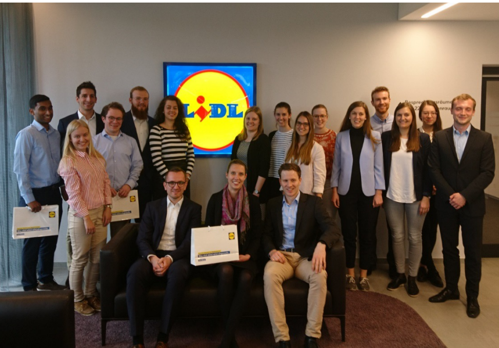
Zu Besuch bei LIDL