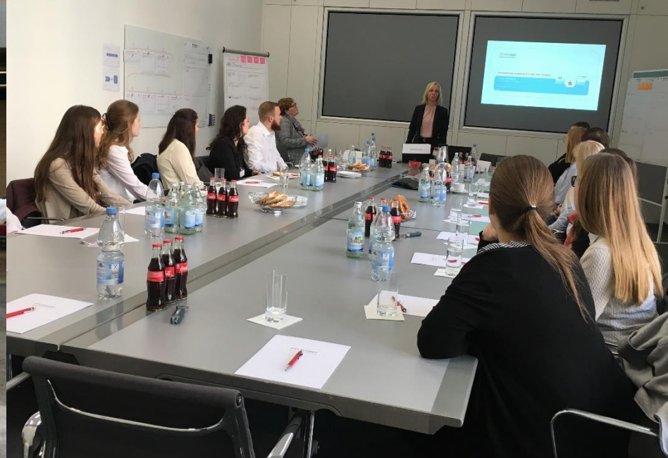
Werksbesichtigung und Produkt-Testing bei Hilti